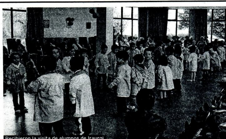
Recibieron la visita de alumnos de Iraurgi.